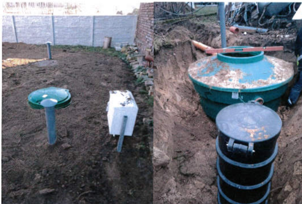
Budowa oczyszczalni ścieków oraz wylotu ścieków oczyszczonych wraz z siecią kanalizacji grawitacyjnej w miejscowości Grabice (bloki) -gmina Gubin