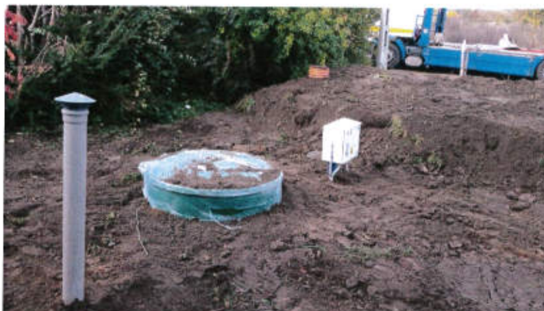
Budowa lokalnej oczyszczalni ścieków dla budynku wielolokalowego w miejscowości Jaromirowice, gmina Gubin