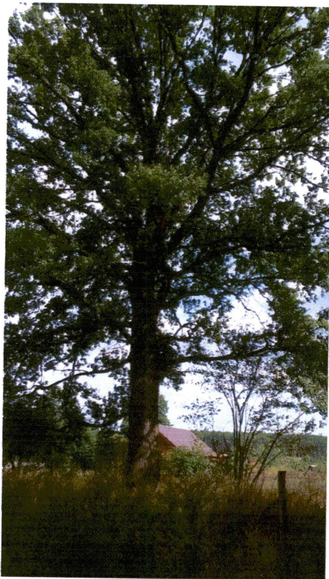
fot. 1, 2 i 3 Zachowany fragment bramy wjazdowej przy drodze gminnej i dąb szypułkowy rosnący na działce nr 155

Jego wiek oraz miejsce posadzenia wskazują na to, że jest częścią dawnego założenia parkowo-pałacowego, określanego obecnie przez mieszkańców Bieżyc, jako "Majątek". Dąb szypułkowy rośnie przy dawnym wjeździe do Majątku, przy pozostałości bramy, która znajdowała się tam przed II wojną światową. Za bramą, po obu stronach drogi rosła aleja lipowa, która została w połowie usunięta latem 2017 roku. Jej druga część rośnie w lesie na działce nr 223, przy drodze gminnej. Nasadzenia na działce nr 155 oraz na działce nr 223 stanowiły całość, co potwierdza mapa ewidencyjna z 2018 r., gdzie użytek na ww. działkach określono jako Ls III, przedzielony drogą gminną.