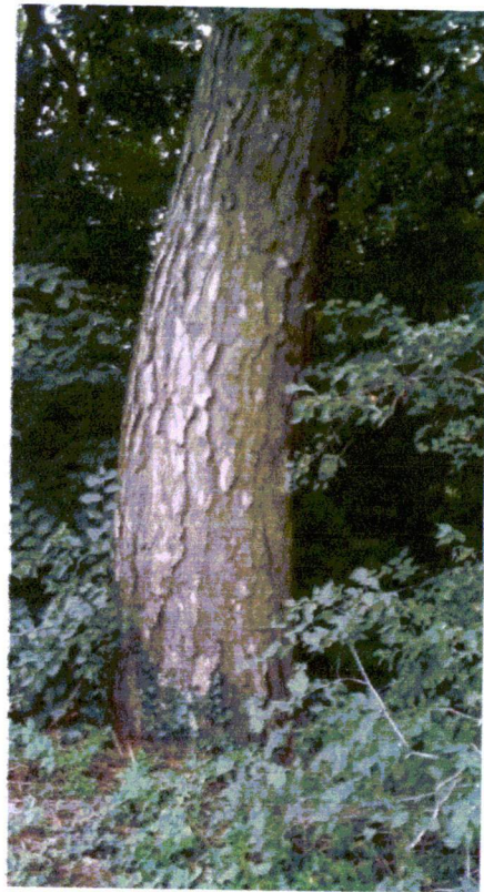
fot.5 i 6 - sosna czarna

Drzewo iglaste ponad 100 - letnie górujące nad drzewostanem dawnego parku przydworskiego. Obwód na wysokości 1,30 cm - 2,40 cm. , o malowniczej, spłaszczonej gęstej ciemnozielonej koronie. Sosna czarna występuje naturalnie na terenie Polski, nie zawsze jednak osiąga tak znaczne rozmiary - ta rosnąca w Bieżycach na działce 223 jest pod tym względem wyjątkowa. Na uwagę zasługuje także fakt, że rosła przy dworku przed II wojną światową (foto nr 2).