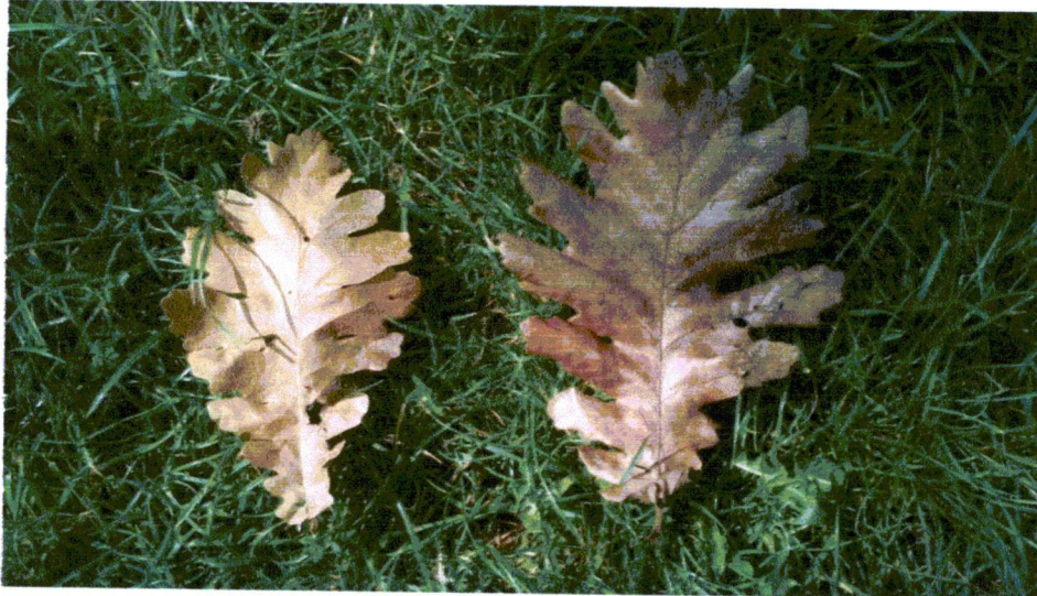
fot.4. Dąb węgierski - działka nr 223 - liść

3) Sosna czarna ( Pinus nigra ) - drzewo obecnie o znacznych rozmiarach, posadzone przed wojną w pobliżu nieistniejącego dworku.