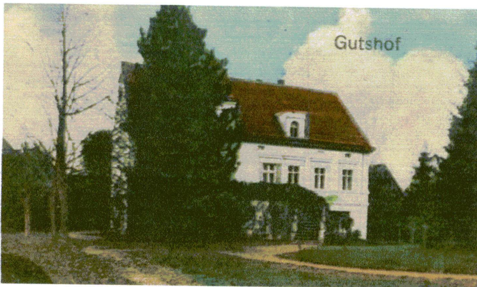
2. Dworek z sąsiadującą z nim sosną czarną

3) Sosna czarna ( Pinus nigra ) - drzewo obecnie o znacznych rozmiarach, posadzone przed wojną w pobliżu nieistniejącego dworku.